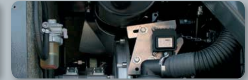
... sparsam & umweltfreundlich!