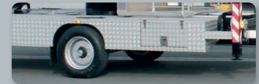
... nützlich & unterstützend!