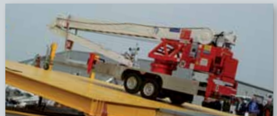
... CLEVER & FLEXIBEL!