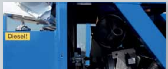
... SPARSAM & UMWELTFREUNDLICH!