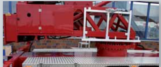
... PRAKTISCH & VARIABEL!