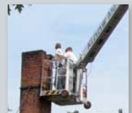
... CLEVER & FLEXIBEL!