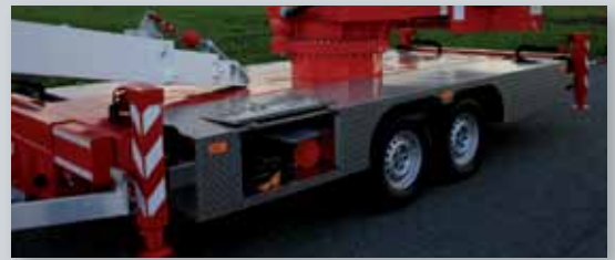
... SICHER & ATTRAKTIV